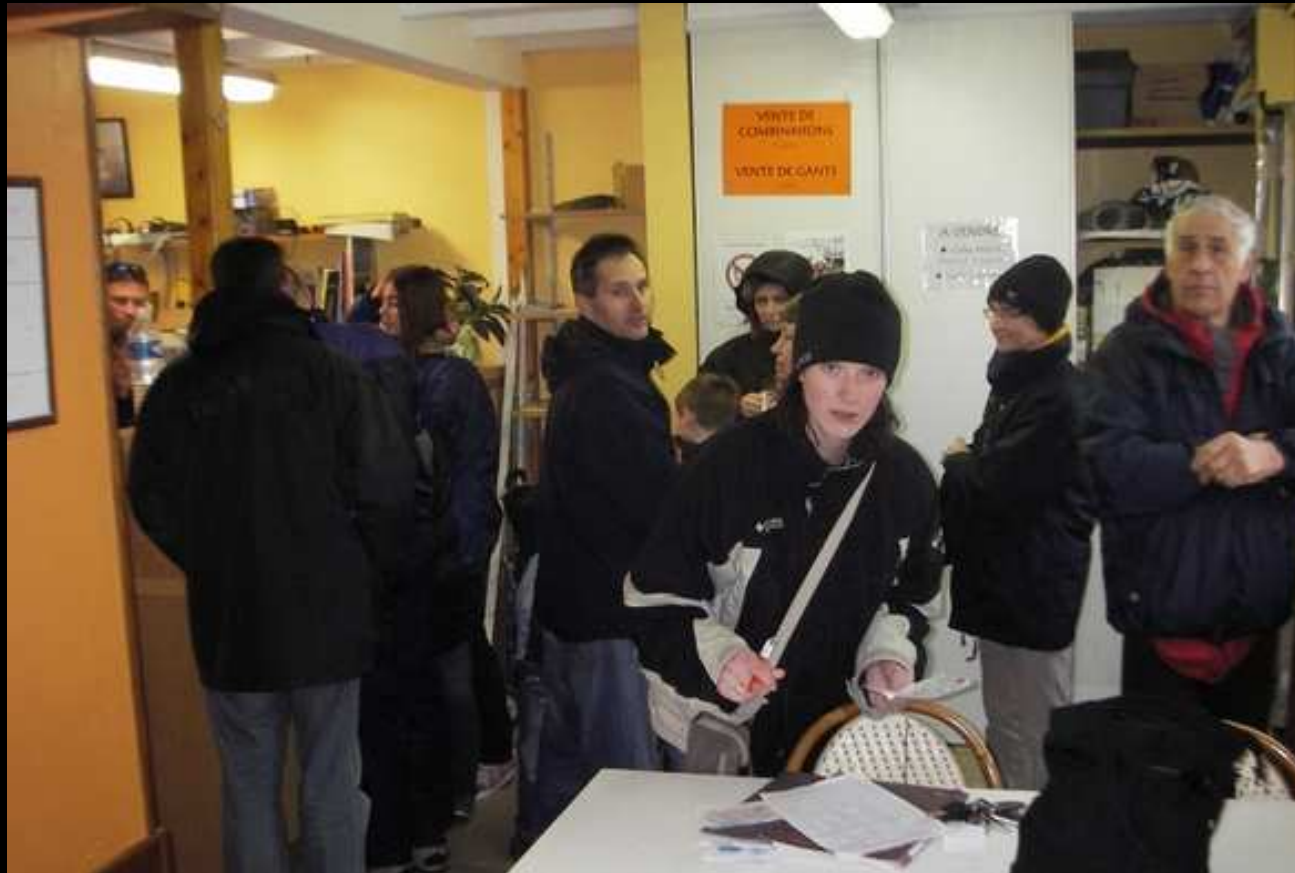
Contrôle d'identité à la frontière France/Pas de Calais