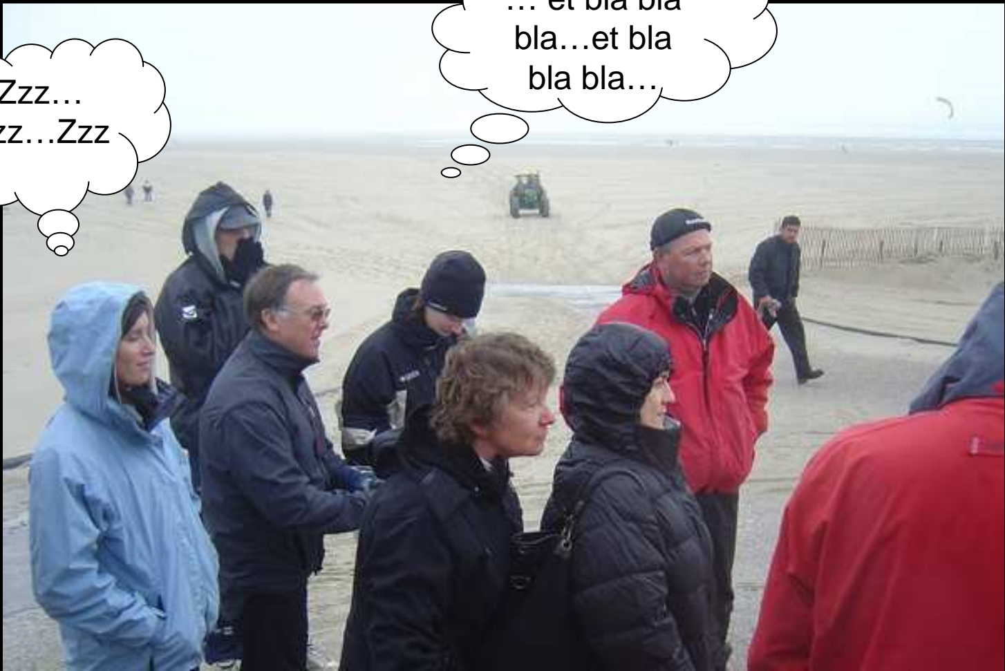
Briefing côté face