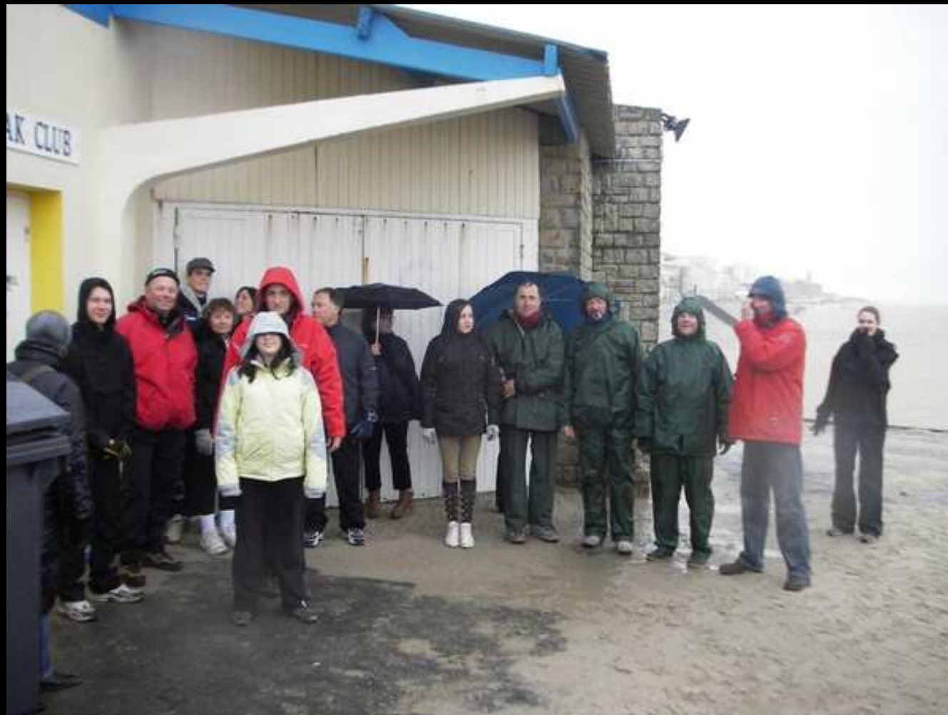
Rassemblement de la troupe